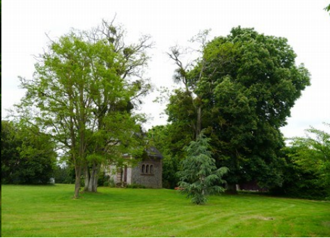
La chapelle vue depuis le parc