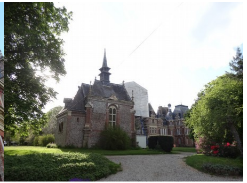
La façade principale