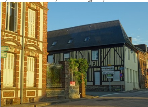
Des édifices avec briques ou pans de bois