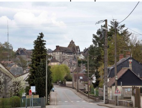
La Neuve Lyre