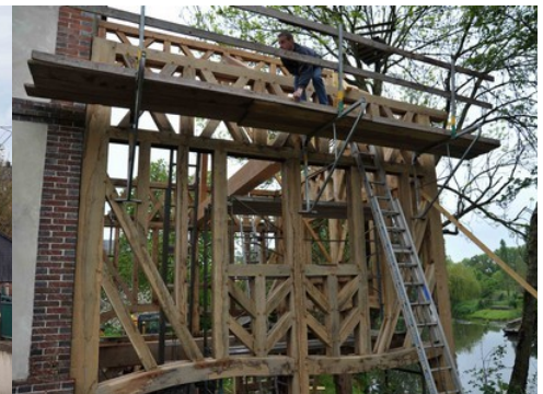
Un exemple d'extension à colombage