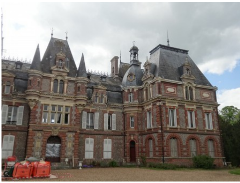
La façade Est du château