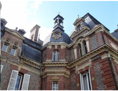
Un détail de la façade