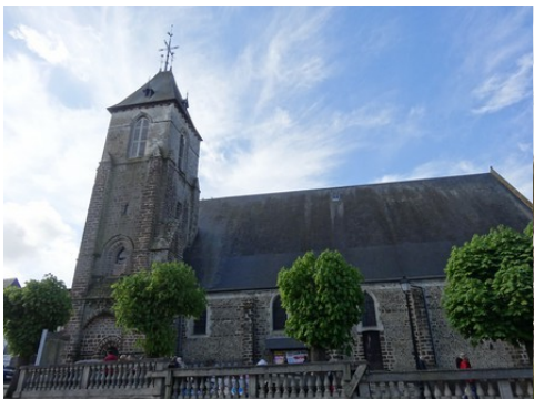
L'église de la Neuve Lyre