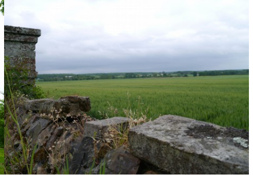
La vue sur les champs alentours