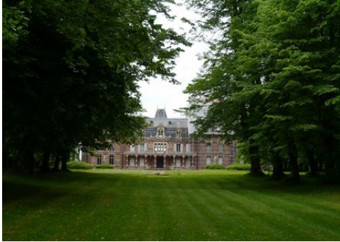
La façade Ouest vue depuis le parc