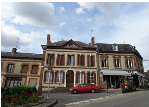
Le bâti rural alentour

Les avis seront cohérents avec ceux émis ces dernières années, à savoir : pas de maisons à volume compliqué (type V, W, Y, ou Z), pentes à 45° pour les volumes principaux, ardoise ou tuile plate de teinte brun vieilli, à 20u/m 2 , avec un débord de toiture de 20cm, enduit de teinte beige clair avec modénatures (au choix : chaînages, encadrement de fenêtres, soubassement, colombage...). *Voir les autres fiches.